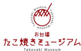
「お台場たこ焼きミュージアム」新ロゴ

「お台場たこ焼きミュージアム」は、大阪で人気のたこ焼きの名店5店舗のほか、たこ焼き関連商品や大阪みやげの販売店「いちびり庵」、低脂肪・低カロリーでヘルシーなジェラートの「ヨゴリーノ」で構成する、2010年11月にオープンしたフードテーマパークです。725.94㎡にわたるフロアで、本場の職人が焼き上げたアツアツのたこ焼きをお召しあがりいただけます。正統派の元祖たこ焼きからこだわりの創作たこ焼きまで、個性豊かな味わいが楽しめることから、幅広い世代から人気を集めています。