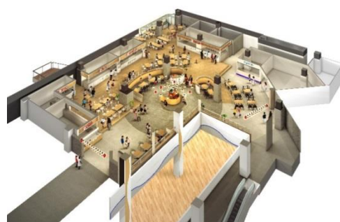
「お台場たこ焼きミュージアム」全体イメージ

「お台場たこ焼きミュージアム」は、大阪で人気のたこ焼きの名店5店舗のほか、たこ焼き関連商品や大阪みやげの販売店「いちびり庵」、低脂肪・低カロリーでヘルシーなジェラートの「ヨゴリーノ」で構成する、2010年11月にオープンしたフードテーマパークです。725.94㎡にわたるフロアで、本場の職人が焼き上げたアツアツのたこ焼きをお召しあがりいただけます。正統派の元祖たこ焼きからこだわりの創作たこ焼きまで、個性豊かな味わいが楽しめることから、幅広い世代から人気を集めています。