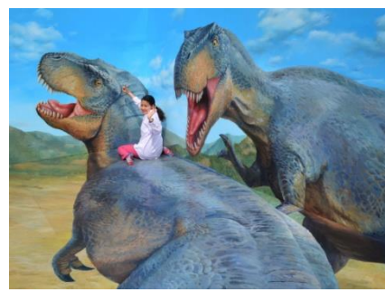
左:江戸テーマゾーン「お神輿わっしょい」 中央:同「餅屋」 右:トリックアート名作ギャラリー「恐竜の背中に乗って大冒険」