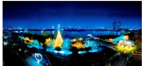
左上:「イリュージョンドーム」、上右:「お台場イルミネーション“YAKEI”」全体イメージ (左下が『ハートのオブジェ』、中央が『樹木イルミネーション』)、下「ハートのオブジェ」(全てイメージ)