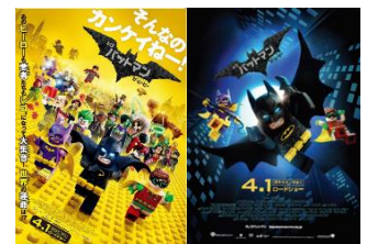
ノベルティカードイメージ