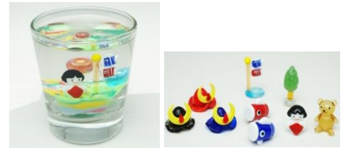
左:キャンドルアート 右:ガラス細工イメージ