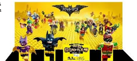
フオトスポットイメージ