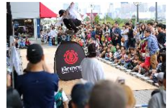
スケボーパフォーマンス イメージ