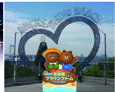
左：「イリュージョンドーム」(イメージ)、右：「ブラウンとブラウンおじさんのハート型フォトスポット」(イメージ)

屋外体感型イルミネーション「ILLUSION DOME(イリュージョンドーム)」では、ドームの中に立つと、360度LINEキャラクターたちの映像に囲まれ、まるで「LINE ブラウンファーム」の世界に入り込んだような体験ができます。さらに、樹木イルミネーションと東京湾を一望できるスポットには「ブラウンとブラウンおじさんのハート型フォトスポット」が登場。ブラウンと一緒に写真を撮れるだけでなく、設置されたスイッチを押すとゲーム内のキャラクターの声とともに光の演出も楽しめます。お台場の空間で『LINE ブラウンファーム』の世界を楽しむことができる、デックス東京ビーチならではの取り組みです。