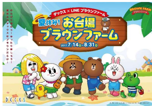
「メインビジュアル」

今回の夏休みイベントでは、人気のLINEキャラクター「ブラウン」が登場する『LINE ブラウンファーム』のように、デックス東京ビーチでたくさんのブラウンやLINEキャラクターたちと館内で出会えます。デックス東京ビーチの通年点灯型イルミネーション「お台場イルミネーション“YAKEI”」では、『LINE ブラウンファーム』の世界観を表現したイルミネーションを点灯します。さらに、『LINE ブラウンファーム』のゲーム内でも、デックス東京ビーチオリジナルのちびブラウンやデコアイテムなどを、プレイヤー全員にプレゼントします。