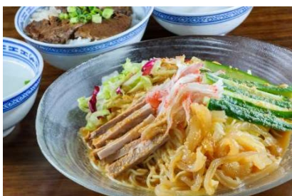
新記「ゴマだれ冷麺」

この夏だけの限定メニューや、家族が笑顔になるメニューが勢ぞろいしました。お食事やカフェタイムに家族やグループで楽しく過ごせます。