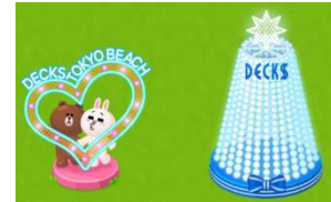
左:「デックスハートフォトスポット」