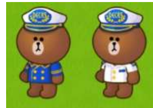
左:「お台場ブラウン」、右:「デックス船長ブラウン」

第2弾:7月21日(金)11:00から7月28日(金)10:59(デックス船長ブラウン)