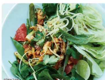
bills「チキンとグリーンパパイヤのスパイスサラダ」