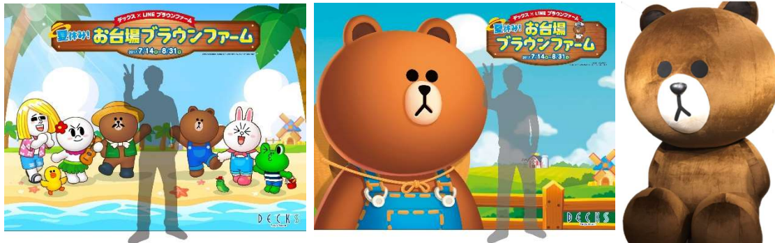
左・中央：フォトスポットバナー（イメージ）、右：「エアブラウン」（イメージ）