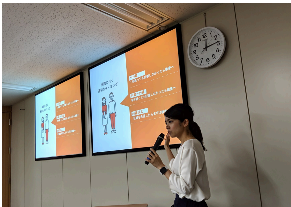
▲ファミワンの不妊症看護認定看護師による当日のセミナー風景