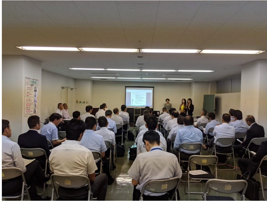
▲当日の講演の様子