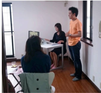
▼妊活基礎講座開会の挨拶