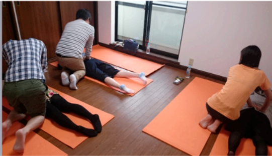
▼夫婦ふたりで取り組むカップルヨガの体験