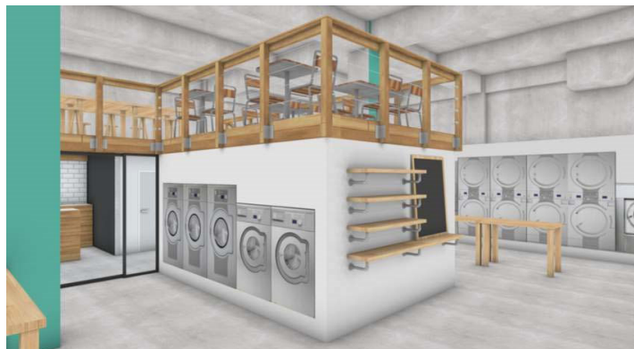
&lt;WASH&amp;FOLD 左富士店 店舗イメージ&gt;

エレクトロラックス・ジャパン株式会社（本社：芝公園）の洗濯機・乾燥機が導入されたコインランドリー「WASH&FOLD（ウォッシュアンドフォールド）左富士店」が、5月30日（木）、静岡県富士市にオープンします。