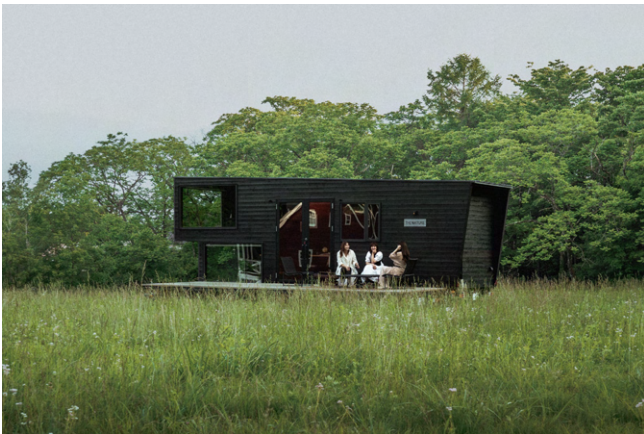
設置後に固定してモビリティを失うトレーラー型キャビンが多い中、THE NATURE モバイルヴィラは、車両番号とモビリティを常に備える