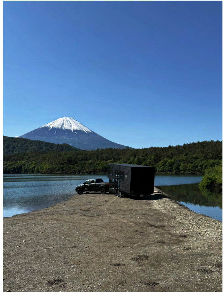
季節に合わせたヴィラの移転を行う〈モビリティサポートサービス〉も予定