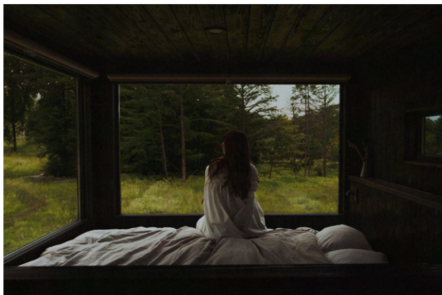
パノラマキャビン内部からのパノラマビュー。巨大な2面ガラスを通して、大自然の眺望が楽しめる。(意匠登録申請中)