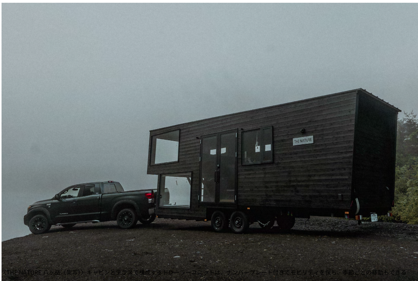
〈THE NATURE ハケ屋 (実写)〉キャビンとテラスで構成するトレーラーユニットは、ナンバープレート付きでモビリティを保ち、季節ごとの移動もできる