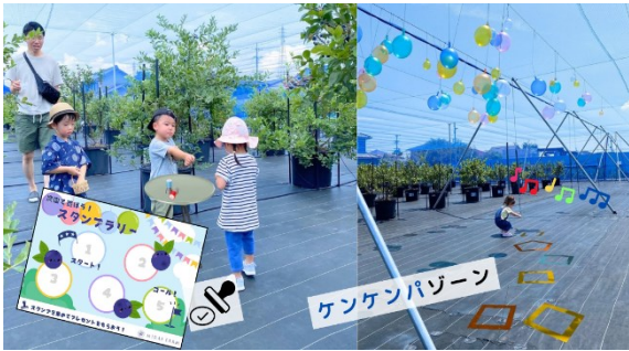
■農園スタンプラリー、ケンケンパゾーン