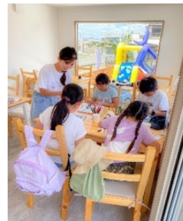
■自由研究イベント 2,500円