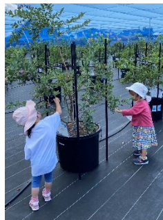
■子ども目線のブルーベリー