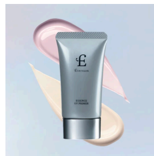
【NEW】エテルナム エッセンスUVプライマー (ライトベージュ/ピンクパープル)