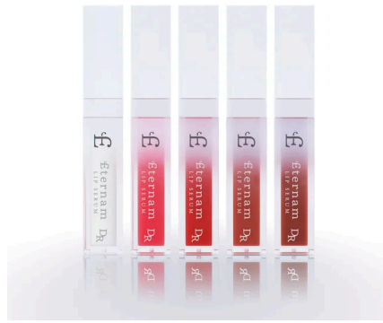
【医療機関専売品】エテルナムDR リップセラム