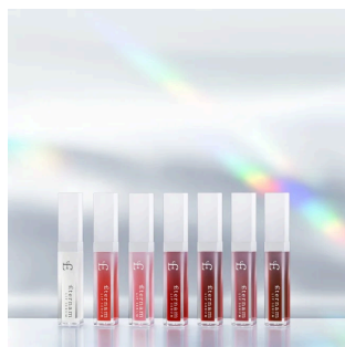
エテルナム リップセラム (A001~A007)