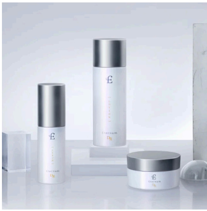
【医療機関専売品】エテルナムDR スキンケア