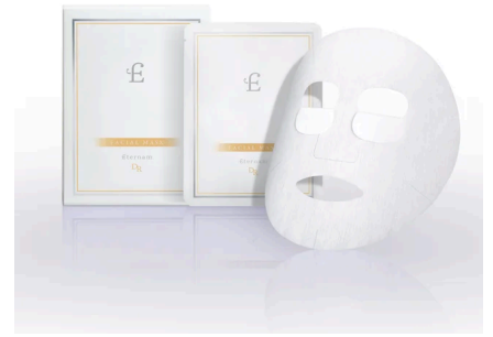
【医療機関専売品】エテルナムDR スキングロウマスクEX