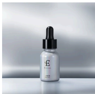
エテルナム 上清原液 SAI TAI