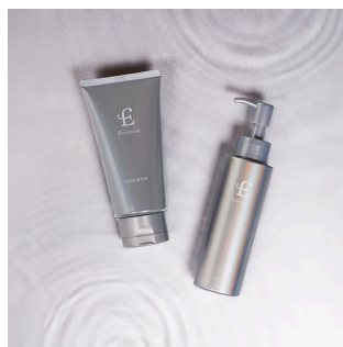
【NEW】エテルナム クレンジングオイル/フェイスウォッシュ