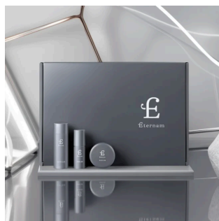
エテルナム トライアルセット