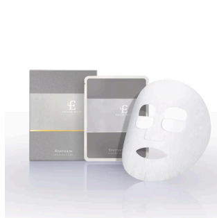
エテルナム フェイシャルマスク EX