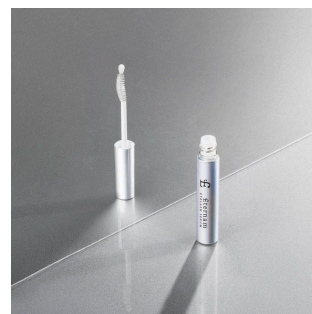
【NEW】エテルナム アイラッシュセラム