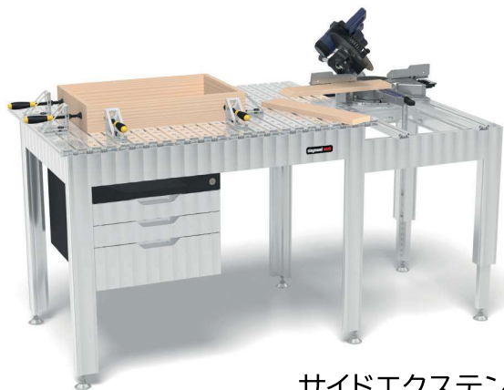
サイドエクステンション装着例