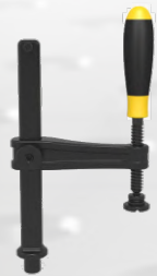
160621 スクリークランプ 4本