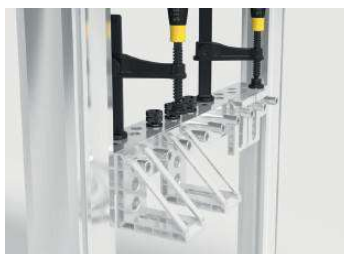
オプション②：ツールホルダー