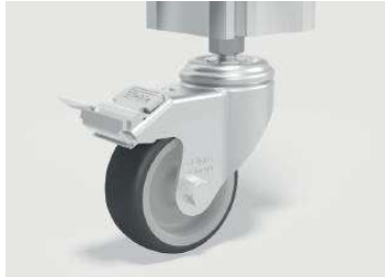
オプション③：キャスター