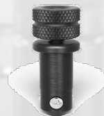
160511 クランピングボルト 8本