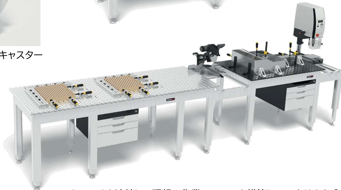
ワークベンチを連結して理想の作業スペースを構築してみませんか？