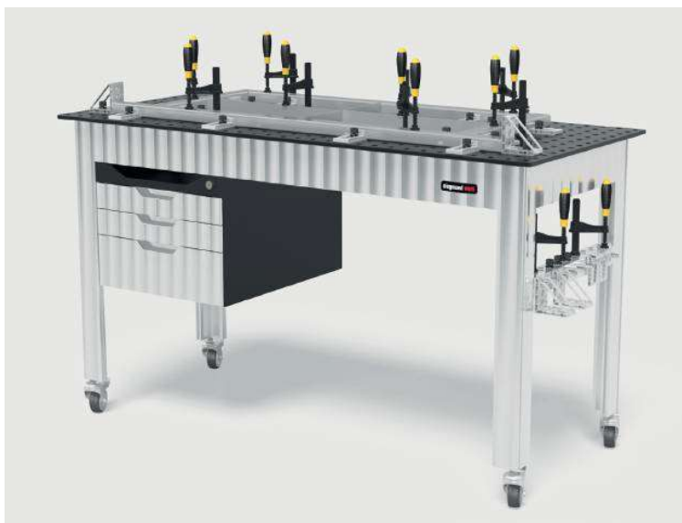
オプション①：引出し