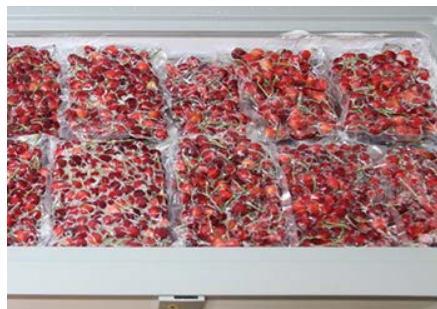
買取した完熟佐藤錦を特殊冷凍保存