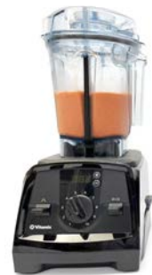
褐変防止ピューレ (特許出願予定)