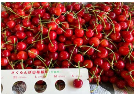
出荷出来ない完熟佐藤錦を買取

※食べ頃でご家庭へ届けるため完熟前に収穫されてしまい 100% のおいしさは農家でしか味わえない。