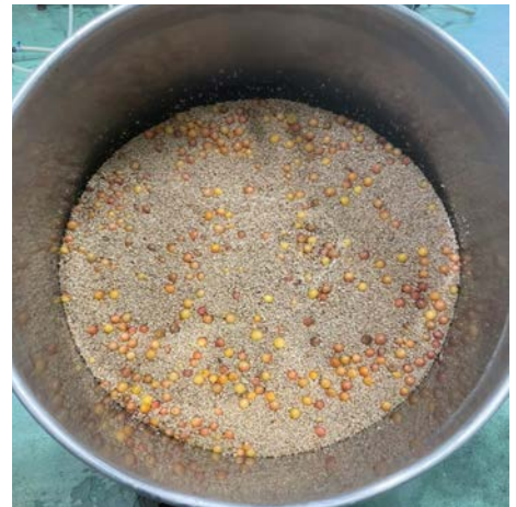
麦汁を絞ったカスは 米沢牛の飼料に (SGDs)