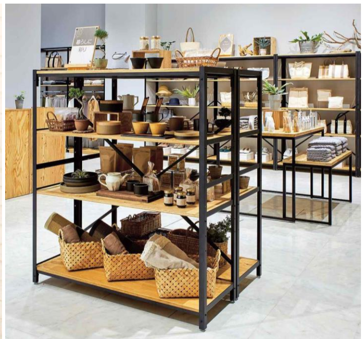
L アンゲルシェルフラック ※陳列商品は、イメージです

「TEN TO TEN - MARKET」は、インテリア雑貨・ファッション・キッチン雑貨・食品など約1万点以上を取り扱う卸・仕入れサイトです。当社は、これまで「TEN TO TEN - MARKET」を通じて、流行商品に加えてバイヤー目利き商品や希少性の高い逸品など幅広いラインナップの商材を提供することにより、小売店とのリレーションを強化してまいりました。今回の店舗什器販売開始により、サイトユーザーが「TEN TO TEN - MARKET」の豊富な商品と組み合わせながら、売り場の魅力を最大化する什器をワンストップで仕入れることができるようになります。