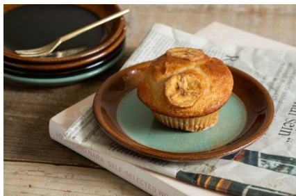
商品名:2tone 5寸皿 15cm 価格:1,980円(税込)