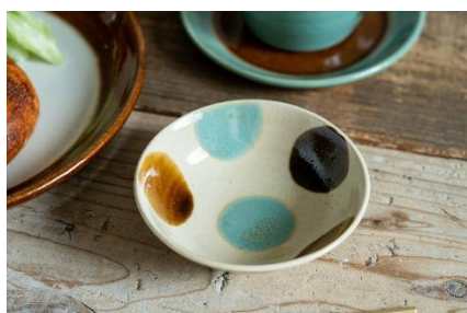
商品名:sansai 浅鉢小 価格:1,540円(税込)