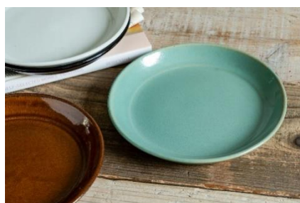
商品名:mashiko 8寸皿 24cm 価格:3,520円(税込)