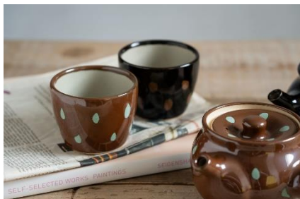
商品名:あずき・しずく カップ 価格:1,760円(税込)