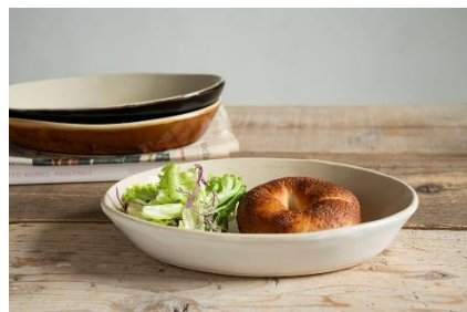
商品名:canvas 楕円鉢 価格:4,180円(税込)