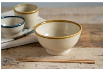
商品名:かわくジラ 碗 大 価格:2,860円(税込)