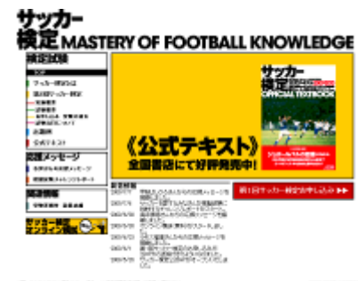
『『サッカー検定』公式サイト』