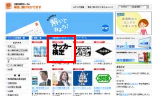
「検定、受け付けてます」