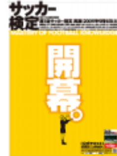
『第1回サッカー検定』ポスター

試験名 : 第1回 サッカー検定 検定料 : 5級 単願 3,500円(税込) : 4級 単願 4,000円(税込) : 5級/4級 併願 7,000円(税込) 試験日程 : 2009年9月5日(土) 5級/4級 各60分 * 第2回サッカー検定は、実施エリアを拡大し、2010年2月を予定