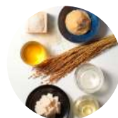
山形県鶴岡市 熟成酒粕エキス