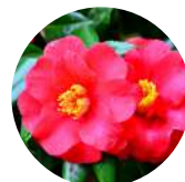
ヤブツバキ 東京都利島