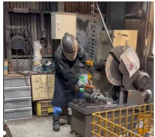
製品を切断機へ設置する作業

自動化を行うことで従業員の作業負荷が軽減、さらに安全を確保し、 年間で 315 時間の生産可能時間の創出、売上高で 1 億円ほど増加する見込み です。