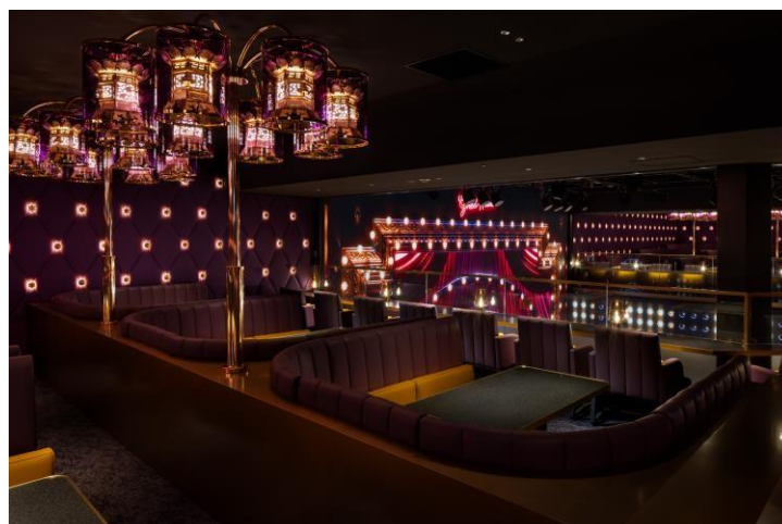
4階『グランカフェラウンジ』