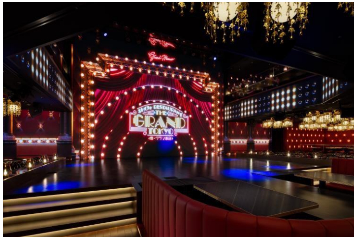
3階『座・グラン東京』