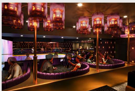
4階『グランカフェラウンジ』