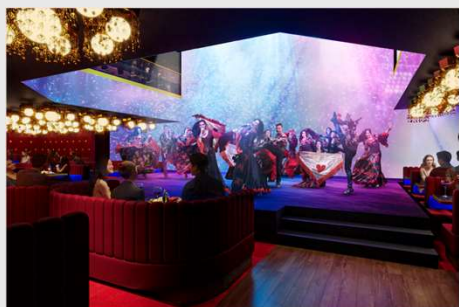
3階『座・グラン東京』

派手さの中にもスマートさを置いて、品のあるミュージカルスタッフを意識しました。比較的わかりやすいテーマ設定でしたが、お客様の笑顔が見えるまでのビューティー要素とクール要素の調整業務に時間を要しました。結論、エレガントです。