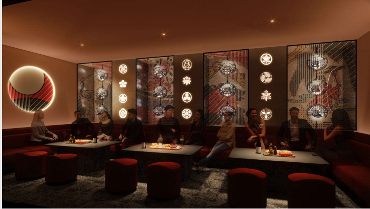
『HAMACOM (ハマコム) 』

テーマは速度。動いた時に風の香りと時の音を感じられる様に袖と裾のボリュームとスペース、それらをサポートするシルエットを体現しています。和のデザインは、そこに流れる時間を大切にしたいと常日頃から思っています。