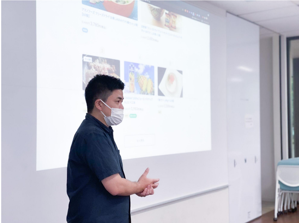
▲クラダシのビジネス・フードロス問題の紹介