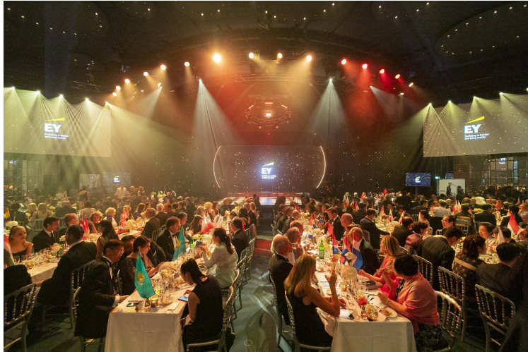
▲WEOY2019 各国代表の紹介・表彰および世界一を発表するアワードセレモニーの様子

クラダシは、食品の賞味期限の切迫や季節商品、パッケージの汚れやキズ、自然災害による被害などの要因で、消費可能でありながら通常の流通ルートでの販売が困難な商品を買取り、社会貢献型ショッピングサイト「KURADASHI」で販売することでフードロスの削減に取り組んでいます。