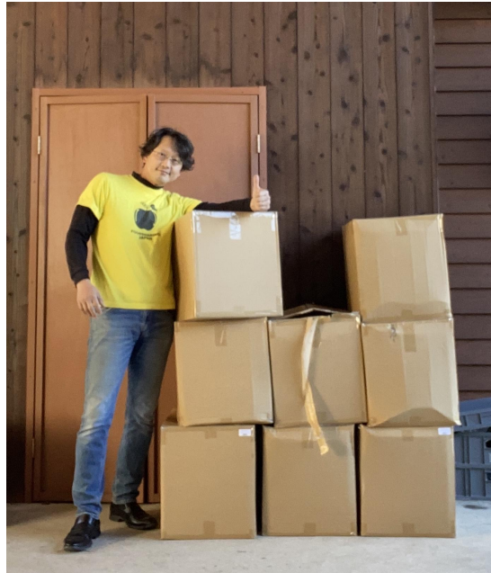
※提供元: ジャパンハーベスト

このシステムでは、クラダシが食品関連事業者より寄贈品を集め、社会貢献型ショッピングサイト「KURADASHI」に掲載。フードバンクはKURADASHIに会員登録し(※1)、専用ページで寄贈品を確認後、自団体の倉庫の規模や環境に合わせて必要な時に必要な分だけ寄贈品を受け取ることができます。