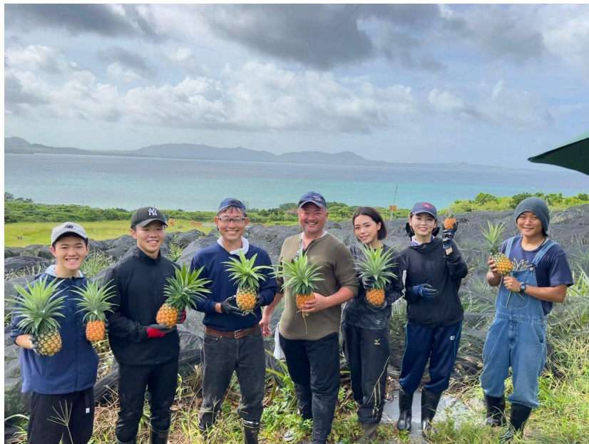
△2022年7月に石垣市にて開催されたクラダシチャレンジの様子

クラダシとロート製菓は石垣市との3者連携を締結しており、フードロス削減や循環型農業の実現を目指し、2022年7月には石垣市にてパイナップルの収穫支援を行う社会貢献型インターンシップ「クラダシチャレンジ」を実施いたしました。