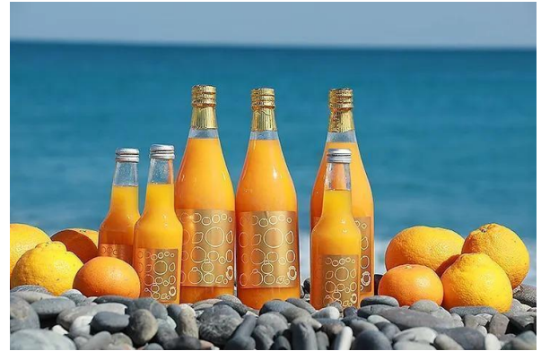
担い手不足によって未収穫となるみかんを学生が収穫してみかんジュースに加工