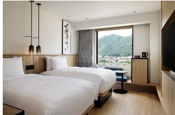
フェアフィールド・バイ・マリオット・三重御浜