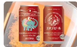
エチゴビール「紅茶香るインディアパールエー...