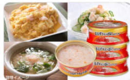
マルハニチロ「まるずわいがにほぐしめ (3缶) ...