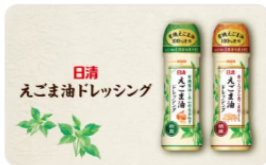
日清オイリオ「日清えごま油ドレッシング」2種...