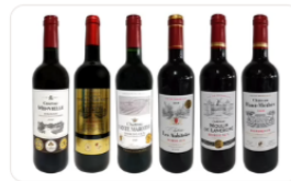
「厳選! ボルドー金賞ワインセツ」750ml×6本