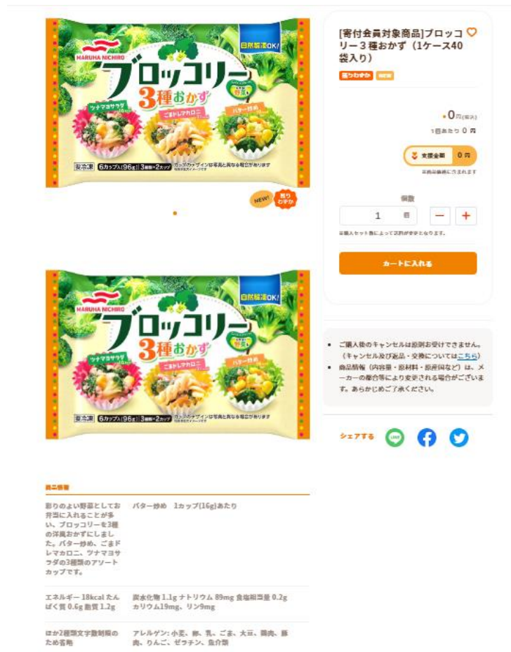
▲マッチングシステム画面のイメージ