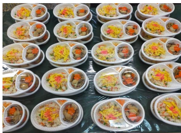
▲子ども食堂での調理の様子（左） 子ども食堂で寄贈食品を活用して提供された食事（右）