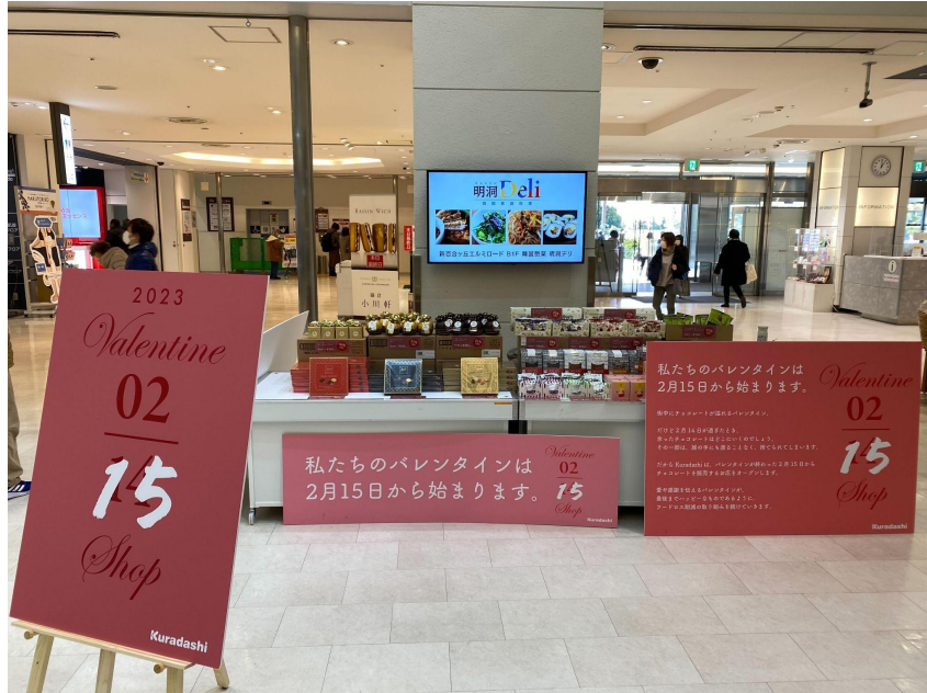
△新百合ヶ丘エルミロードPOPUP SHOPの様子