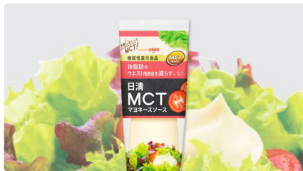
日清オイリオ 「日清MCTマヨネーズソース」 210g