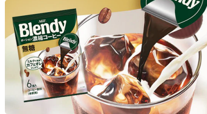
ブレンディ 「ポーション濃縮コーヒー 無糖6個」