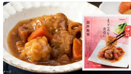
tabete 「黒酢豚」 110g

今後もクラダシはフードロス削減を目指し、ソーシャルグッドマーケット「Kuradashi」を通じて、楽しくておトクなお買い物が、社会に良いことにつながる。そんな、全く新しいソーシャルグッドマーケットを創出してまいります。