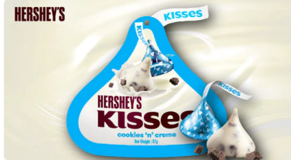
HERSHEY'S 「キスチョコレートクッキー&クリーム」