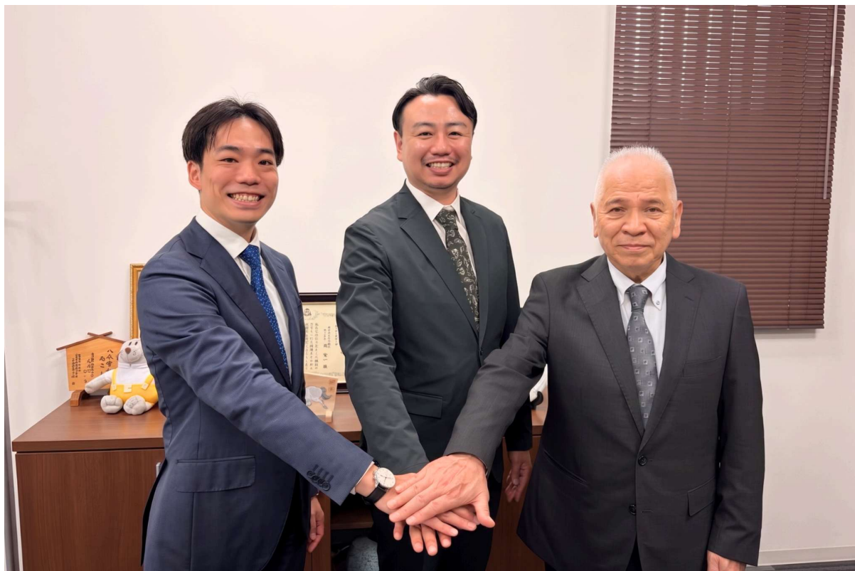
契約締結調印の様子（7月1日）

株式会社中村商事は、有限会社中村商事が運営する酒類・飲料等の小売事業を会社分割（新設分割）して2026年6月16日に設立された会社です。