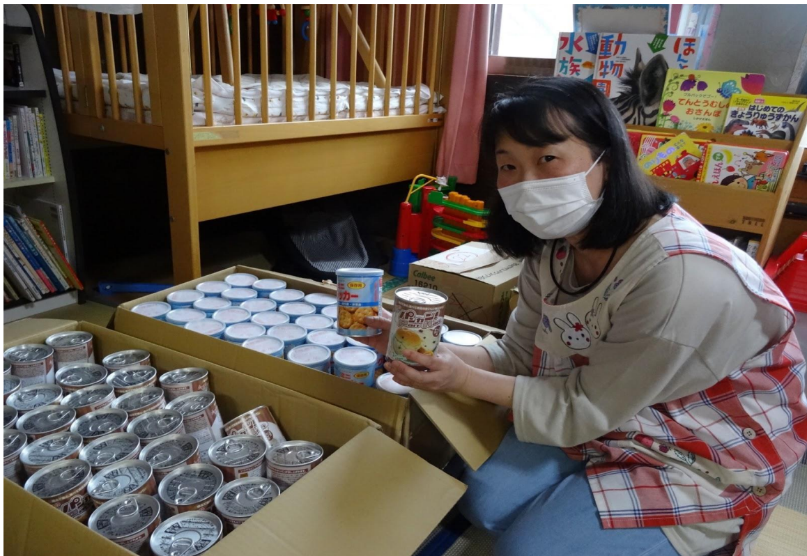
※認定NPO法人ハーモニーネット未来を通して寄付商品を受け取った フード&ライフドライブ活動「てとて」の写真

なお、この度の寄付にかかった配送コストは、クラダシが2019年に設立したフードバンク支援や地方創生を実現するための基金「クラダシ基金」から拠出されています。