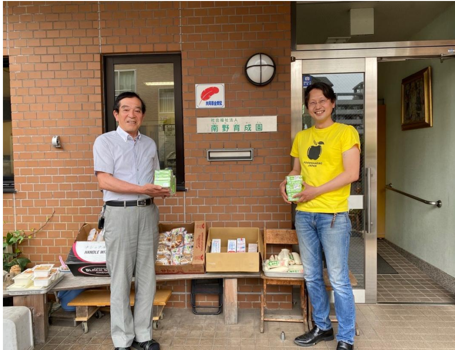
※提供元: ジャパンハーベスト

各フードバンクでは、これらの寄付商品を生計困窮世帯や子ども食堂へ配布する等、有効活用します。なお、この度の寄付にかかった配送コストは、クラダシが2019年に設立したフードバンク支援や地方創生を実現するための基金「クラダシ基金」から拠出されています。