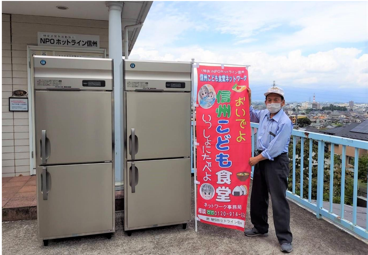
▲クラダシが寄付した冷凍庫