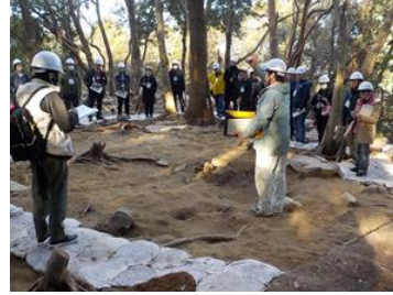
安土城跡を発掘調査員により現地解説