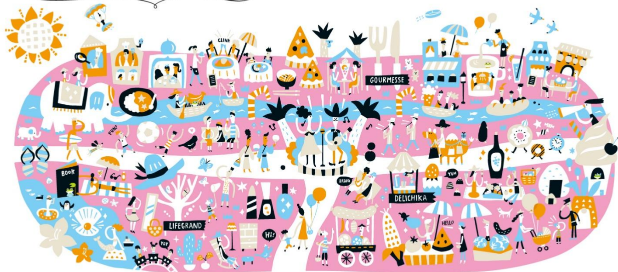
第2弾 2016年夏ビジュアル「まいにちエンジョイ、日常トリップ。」