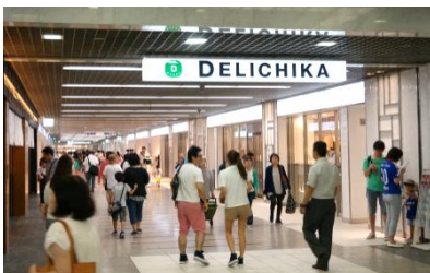
食物販ゾーン 「DELICHIKA(デリチカ)」