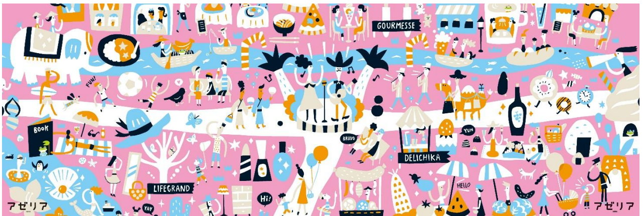
川崎アゼリア 夏のイラストビジュアル

川崎アゼリアは、“人生の豊かな時間を共有するライフシェアモール”をリニューアルコンセプトに掲げ、昨年7月31日に第1期リニューアルとして、食物販ゾーン『DELICHIKA(デリチカ)』を先行オープンいたしました。その後、本年3月16日には、新たにレストランゾーン『GOURMESSE(グルメッセ)』、ライフスタイルゾーン『LIFEGRAND(ライフグラン)』が加わり、お客様のライフスタイルに幅広くお応えする魅力ある商業施設となり、皆様に親しまれております。