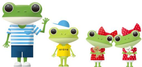
「カワサキカワルクン・オウトくん・カワちゃん・タマちゃん」

アゼリアのマスコットは、「タマちゃん・カワちゃん」も加わり、 4兄弟が元気に活躍中!