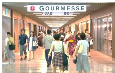
レストランゾーン 「GOURMESSE(グルメッセ)」