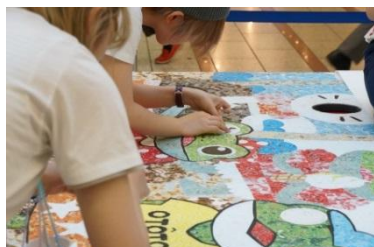
武蔵野美術大学学生の皆様