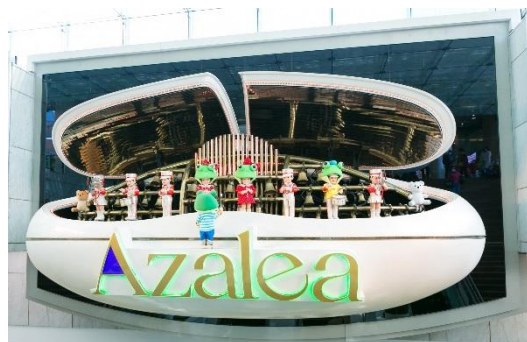
「アゼリア宇宙カプセル」

一昨年の第1期オープン時に初登場いたしました川崎アゼリアの新キャラクター「カワサキカワルクン・オウトくん」には、現在、愛らしい双子の女の子「タマちゃん・カワちゃん」も加わり、4兄弟が揃って元気に活躍中です。川崎アゼリアの名物「宇宙カプセル」では鼓笛隊の中に4兄弟も登場し、毎回の開口時にはお子様たちを楽しませております。4兄弟のオリジナルグッズも「ここでしか買えないレアグッズ」として好評いただいております。