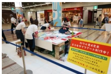
サンライト広場での公開制作

夏休み中盤のイベントとして、川崎アゼリアのマスコットキャラクター「カワサキカワルくん4兄弟」をモチーフに、“カワルくん祭り!”と称した催し事をサンライト広場で実施いたしました。“カワルくん兄弟の夏休み”をテーマにした、古チラシの再利用によるディテールまで丁寧に制作した顔出しモザイクアートは、武蔵野美術大学2~4年生の学生さんたちが、デザイン構想から完成まで全て手掛けてくださいました。その制作途中の作業光景もサンライト広場で公開、完成作品は、お子様からファミリー、ご年配の方々まで幅広く顔出しいただき、皆様写真を撮って楽しんでいただきました。30日(土)には、カワルくん・オウトくんの着ぐるみも登場し会場を沸かせ、カワルくん4兄弟の“ここでしか買えないオリジナルレアグッズ”もたくさんのお客様にお買い上げいただきました。