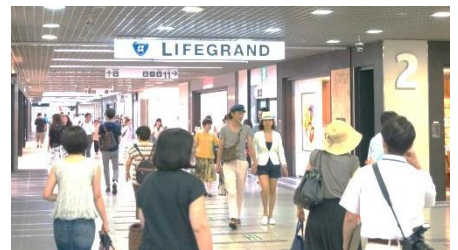
ファッション・雑貨ゾーン 「LIFEGRAND(ライフグラン)」