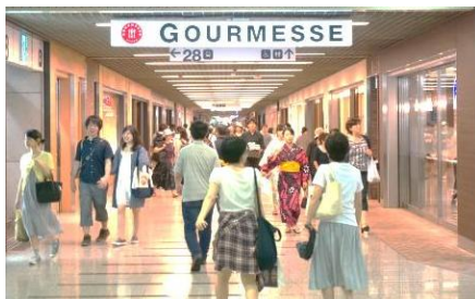
レストランゾーン 「GOURMESSE(グルメッセ)」