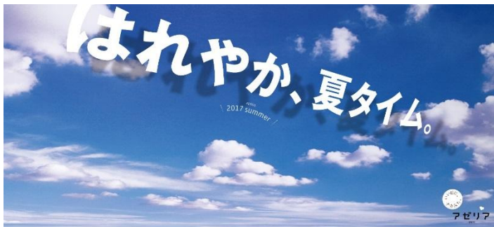
川崎アゼリア 2017年夏のキービジュアル『はれやか、夏タイム。』