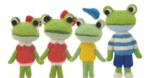
カワサキカワルくん兄弟の人形 ※ワークショップで制作予定