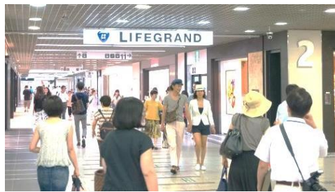
ファッション・雑貨ゾーン 「LIFEGRAND(ライフグラン)」