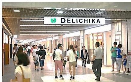
食物販ゾーン 「DELICHIKA(デリチカ)」