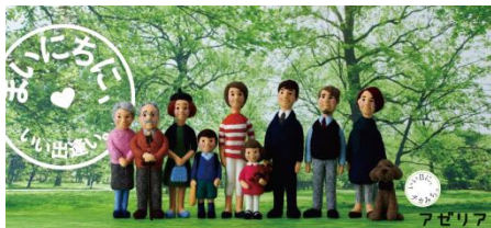
2017春ビジュアル人形

くすのき・ぶお/1984年からイラストレーターとして活動。2D、3Dのさまざまな表現で多岐に及ぶ媒体で活躍。2010年、谷根千エリアに『ツバメブック』『WollyDolly』というフェルトドールのキャラクターを制作。