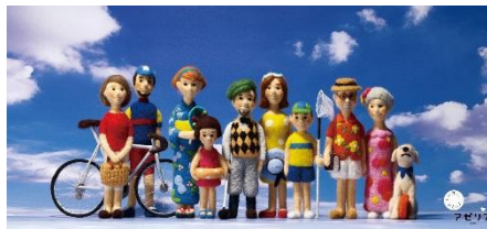
2017夏ビジュアル人形