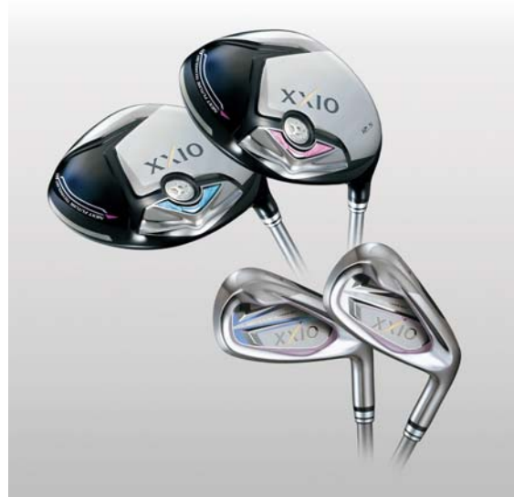
レディースモデル