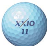
ゼクシオ SUPER XD