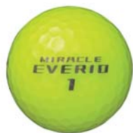
ミラクルエブリオ