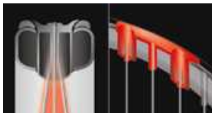
ウェーバーシステムイメージ図

フェイス上部の一部に2重構造のグロメットを採用し、オフセンターショットにおける反発性能、コントロール性能の低下を抑制しました。グロメットには柔らかい素材を使用し、衝撃や振動も抑え、抜群のホールド感を実現しました。