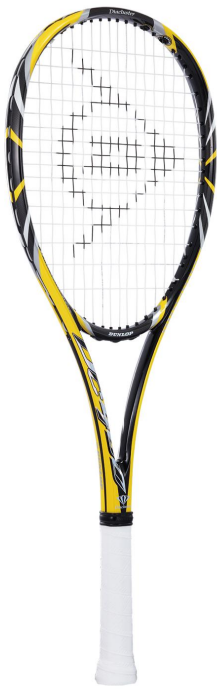
ダイアクラスター 400

ダンロップスポーツ(株)(本社:神戸市、社長:野尻 恭)は、強靱な“ダイヤモンドカーボン”を採用したダンロップ「ダイアクラスター・シリーズ」の軽量オールラウンドモデル「DC400」に新色(イエロー)を追加し、7月30日より新発売します。この「DC400」は、更なるステップアップを目指すプレイヤー向けに、他の軽量モデルよりもやや重く設計されており、ハードヒットしてもしっかりとコースを狙えます。メーカー希望小売価格は16,800円<本体価格16,000円>です。ダイアクラスター・シリーズは全機種、(公財)日本ソフトテニス連盟公認商品です。