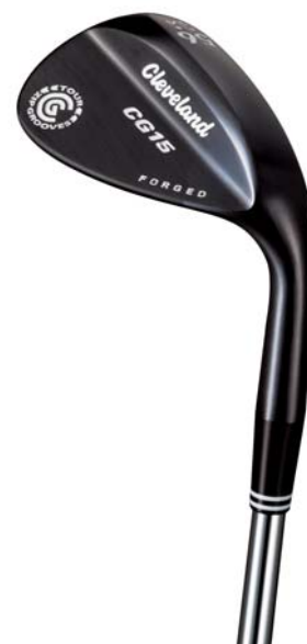
女子プロ使用 CG15 フォージドウェッジ