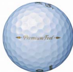
ロイヤルゴールド