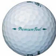
ロイヤルグリーン