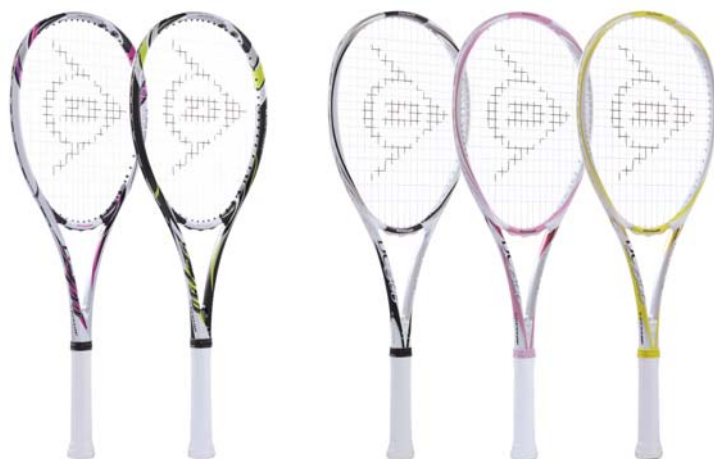
ダイアクラスター 700 / 800