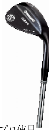
女子プロ使用 CG15 フォージドウエッジ

その他の情報はクリーブランドゴルフホームページをご覧ください www.clevelandgolf.co.jp