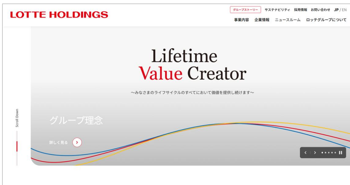
[新コーポレートサイト トップページキービジュアル]

それぞれ「食品」「ライフサイエンス&デジタル」「ライフスタイル&エンターテインメント」の3事業を意味し、これらが重なり合いながら大きくなつねり（成長）を生み出すイメージを表現しています。