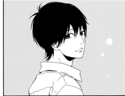
◎その思い出だけは、消さないで。