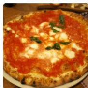
ラ ピッツァ ナボレターナレ カロ 大阪府 大阪市