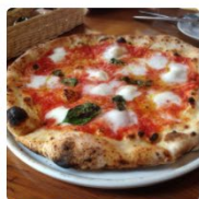
大衆イタリア食堂 アレグロ 大阪府 大阪市