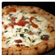
ピッツェリア・ダ・ガエター ノ 福岡県 福岡市