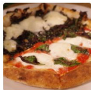
エンボカ東京 東京都 京王・小田急沿線