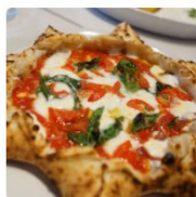
ナポリスタカ 東京都 六本木・麻布・広尾