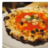
武蔵野キャンパス 東京都 吉祥寺・三鷹・武蔵境