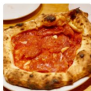
Santo Bevitore 兵庫県 神戸市