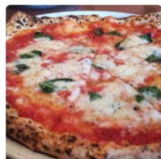
ピッツェリア ダ マッシモ 北海道 札幌市