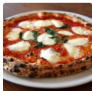
ピッツェリア エトラットリ アダ・マザニエッロ 兵庫県 宝塚・西宮・尼崎