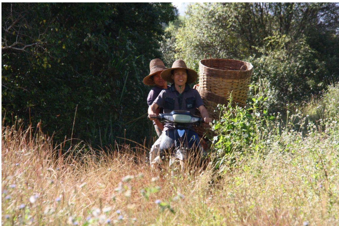
受賞者：namotasaさん 撮影場所：ミャンマー