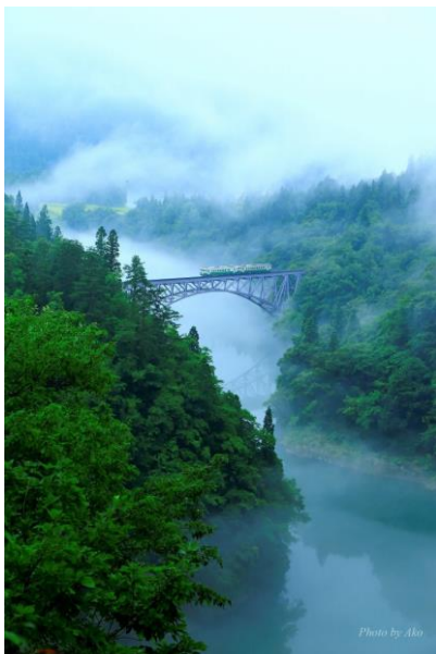
受賞者：クッシーさん 撮影場所：金山・昭和・会津美里（福島）