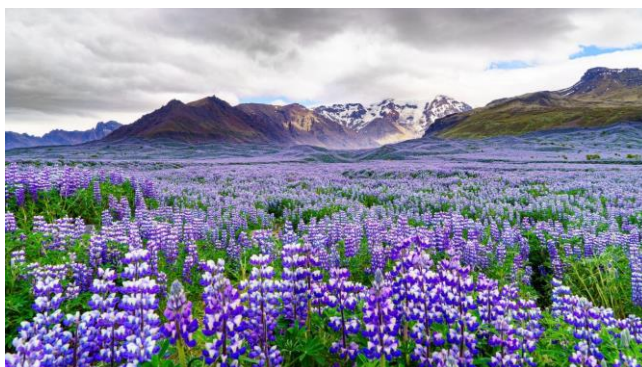
受賞者：コージさん 撮影場所：ヴィーク（アイスランド）