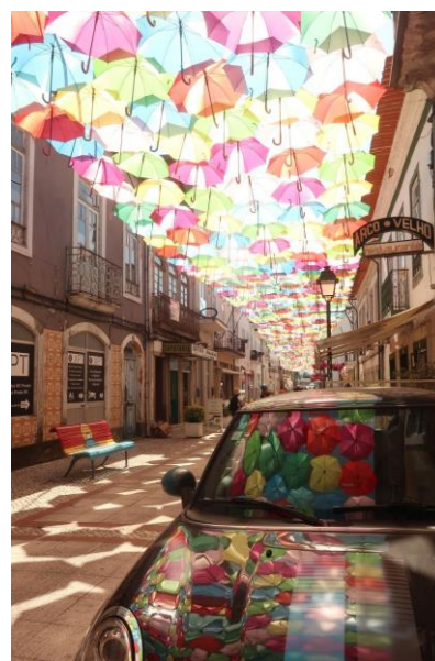
受賞者：ちろるさん 撮影場所：アヴェイロ（ポルトガル）