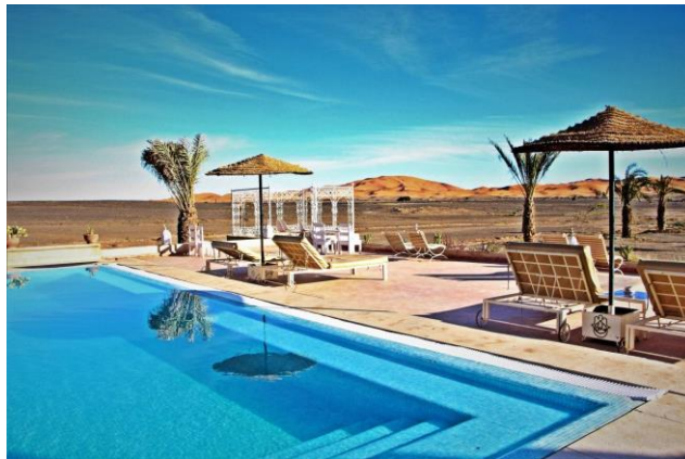
受賞者：ウェンディさん 撮影場所：エルフード（モロッコ）