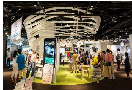
The Lab. みんなで世界一研究所

「ザ・ラボ」では、参画する企業や大学、研究機関による先端技術、研究成果、製品・サービスのプロトタイプ展示や、ワークショップなどの体験プログラムを実施しています。参画者は一般生活者のリアルな反応や意見をダイレクトに収集し、今後の製品開発や商用化、販売展開などへ反映することができます。現在、13の機関が参画し、ナレッジキャピタルの中核機能を担うスペースです。