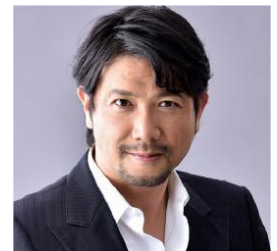
映画祭代表 別所 哲也氏

ナレッジキャピタルでは本映画祭を通じ、大阪・関西から新しいショートフィルム文化を発信してまいります。