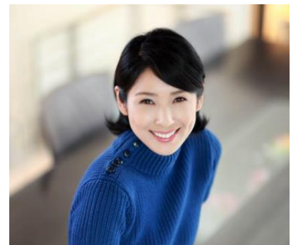
黒木 瞳さんがトークプログラムに登場