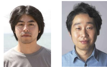
石井 裕也氏(左)と前野 朋哉氏(右)のトークセッションも